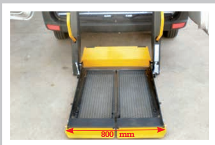
Plataforma Ancho F3HD VS 800mm; F3HD VSL 740mm.